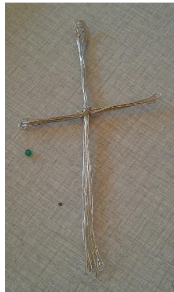
Billede nr. 2