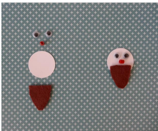
5. Lav ansigter af pap, filt rulleøjne og perler.