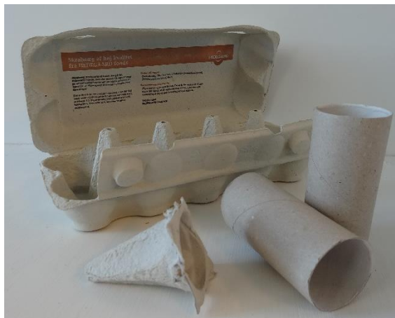
1. Klip dutter af æggebakker til hatte.