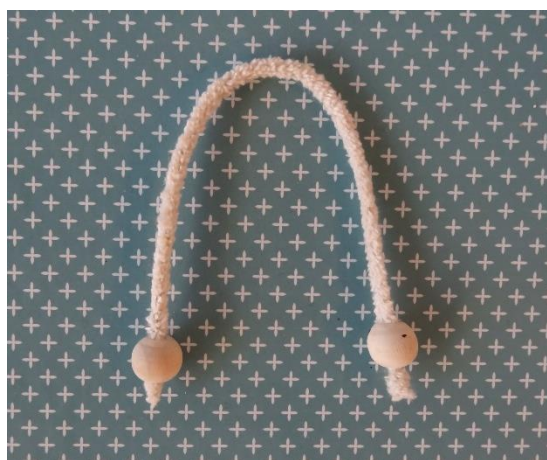
6. Bøj en piberenser til arme og sæt en perle på hver ende som hænder.