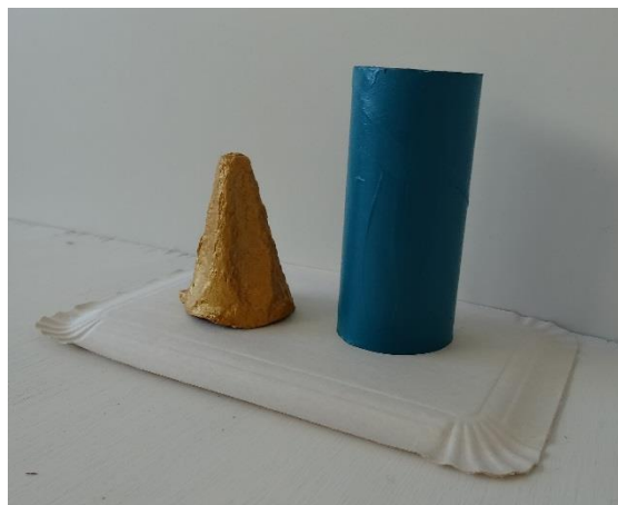
2. Mal dutter og toiletruller (til krop) med akrylmaling.