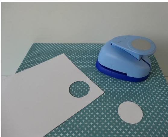
3. Klip ansigter i pap.