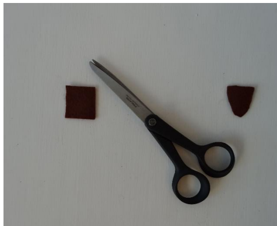
4. Klip skæget ud af filt.