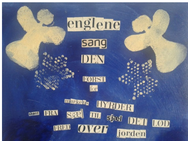
Det færdige resultat